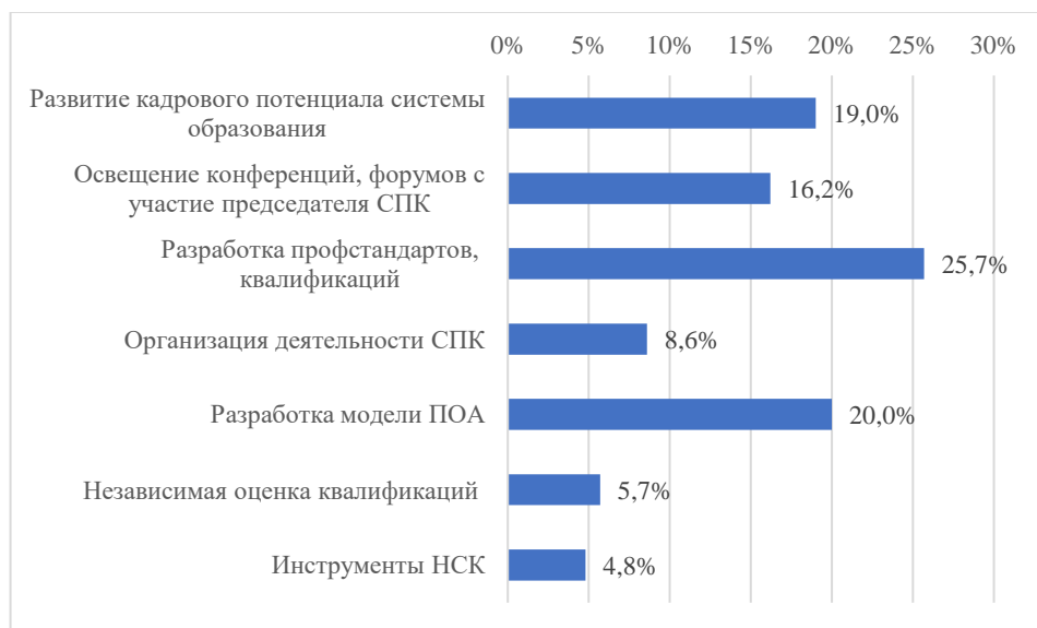
Рисунок 1 - Освещаемые вопросы на странице СПК в сфере образования